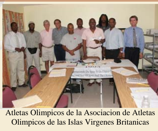
Atletas Olímpicos de la Asociación de Atletas Olímpicos de las Islas Vírgenes Británicas