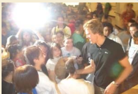
Gary habla con los estudiantes después de su presentación

El 14 de Noviembre, el tres veces Atleta Olímpico Gary Hall Jr., se dirigió a por lo menos 600 estudiantes de 57 escuelas elementales y 39 colegios del condado de Miami-Dade para discutir temas relacionados con la diabetes, parte del programa “Los Atletas Olímpicos Educan.” Este programa fue desarrollado a razón del Acto de Reautorización Nutricional del 2004, que requiere que todas las escuelas del distrito a las cuales se les provee de fondos federales para almuerzos gratis o a bajo costo realicen un programa de bienestar que tenga efecto en la salud física y nutricional de los estudiantes de dicho distrito escolar.