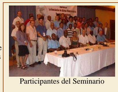
Participantes del Seminario

Durante los dos días de seminario, los Atletas Olímpicos e invitados aprendieron del trabajo de distintas asociaciones y el como incorporar dichos programas en sus países. La WOA esta orgullosa del continuo trabajo que las oficinas regionales han venido realizando y su compromiso con los valores e ideales del Movimiento Olímpico y sus comunidades.