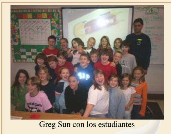
Greg Sun con los estudiantes

Trinidad y Tobago produce algunos de los atletas más rápidos del mundo. Todos conocen a Hasely Crawford y Ato Boldon por los grandes logros obtenidos en las pistas a nivel mundial. Existen otras pistas en donde Trinidad y Tobago también ha ganado reconocimiento internacional. Greg Sun ha representado a su país en tres Juegos Olímpicos de Invierno en la modalidad de trineo. Greg comanda su trineo en Copas Mundiales, la Copa Europea, Copa de las Américas y otros campeonatos por más de 10 años. Su dedicación y habilidades deportivas en esta peligrosa disciplina Olímpica lo distinguen como un modelo para la sociedad.