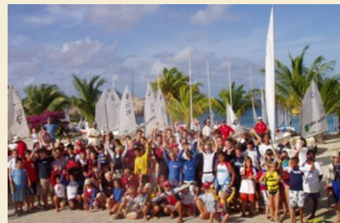
Deportistas en las Antillas Holandesas